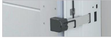
LICHTSCHRANKE FÜR GARAGENTORE